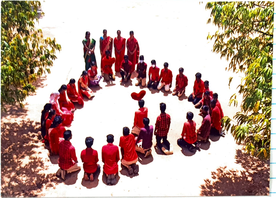
Group photo with III B.Sc. Zoology Students